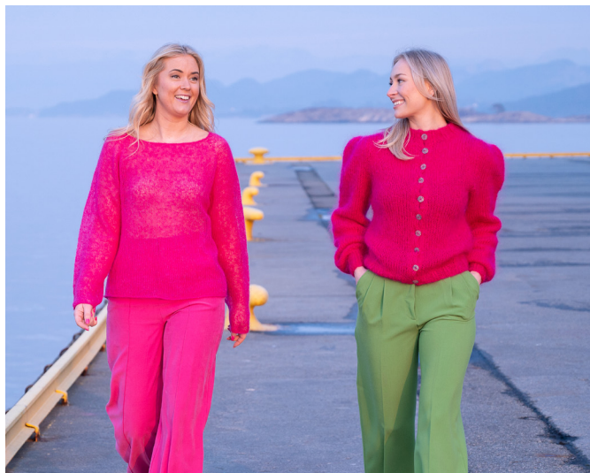
For opskrift på Gally sweater, se DG 451-06