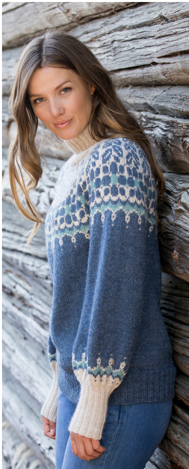
STILST.: JAN GUNNAR SVENSON @STYLESVENSON | DESIGN OG LAYOUT: HOUSE OF YARN

Kopiering og publicering af materiale og opskrifter, eller brug af dette i forretningsøjemed, er kun tilladt efter aftale med House of Yarn AS.