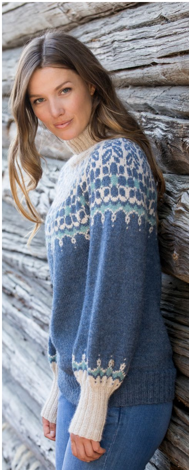
STYLST: JAN GUNNAR SVENSON @STYLETSEVENSEN | DESIGN OG LAYOUT: HOUSE OF YARN

Kopiering og publisering av materiale og oppskrifter, eller bruk av dette i næringsøyemed, er ikke tillatt uten avtale med House of Yarn AS.