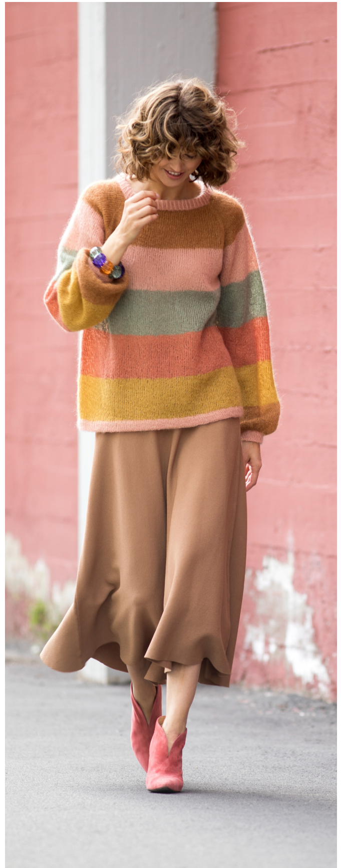
STYLIST: JAN GUNNAR SVENSON @STYLESVENSON

rm = rät maska, am = avig maska, m = maska, st = sticka, v = varv