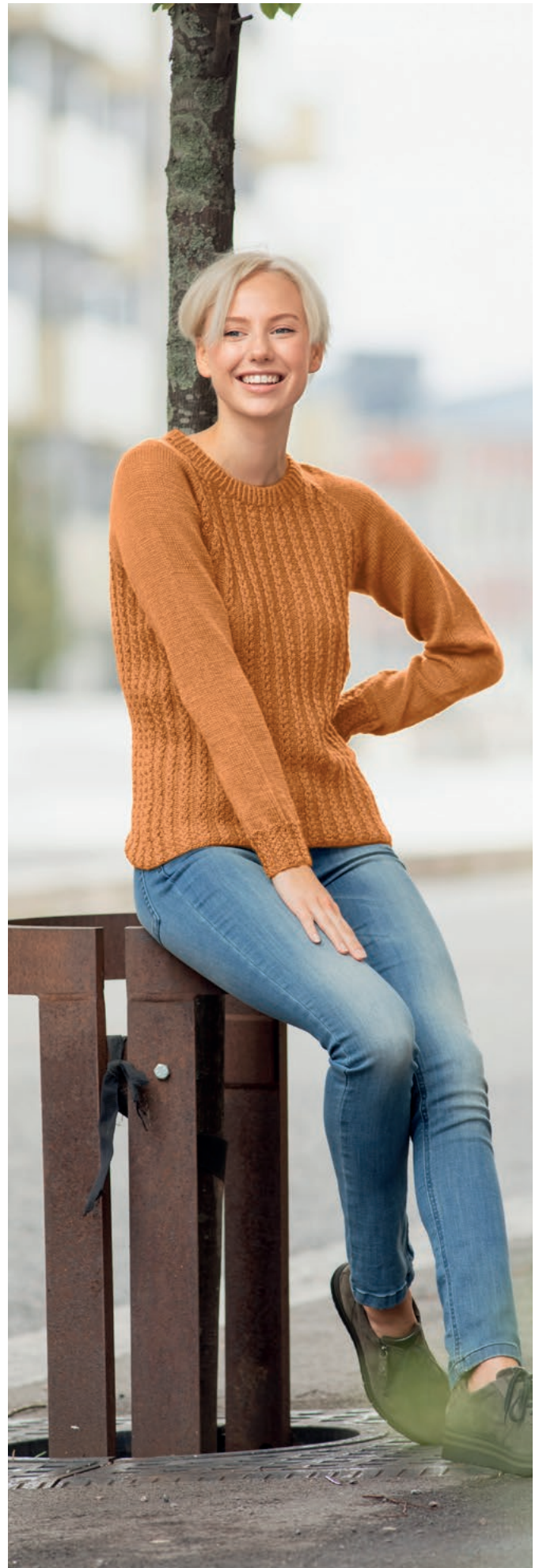
stylist: Jan Gunnar Svenson @stylesvenson

Kopiering och publicering av material och mönster, eller användning av dessa i kommersiellt syfte, får inte ske utan tillstånd från House of Yarn AS.