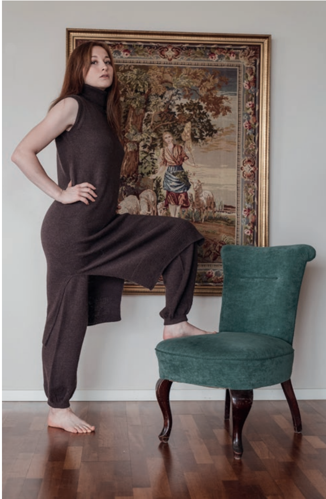
Die Anleitung für das Kleid finden Sie unter DSA 108-02.