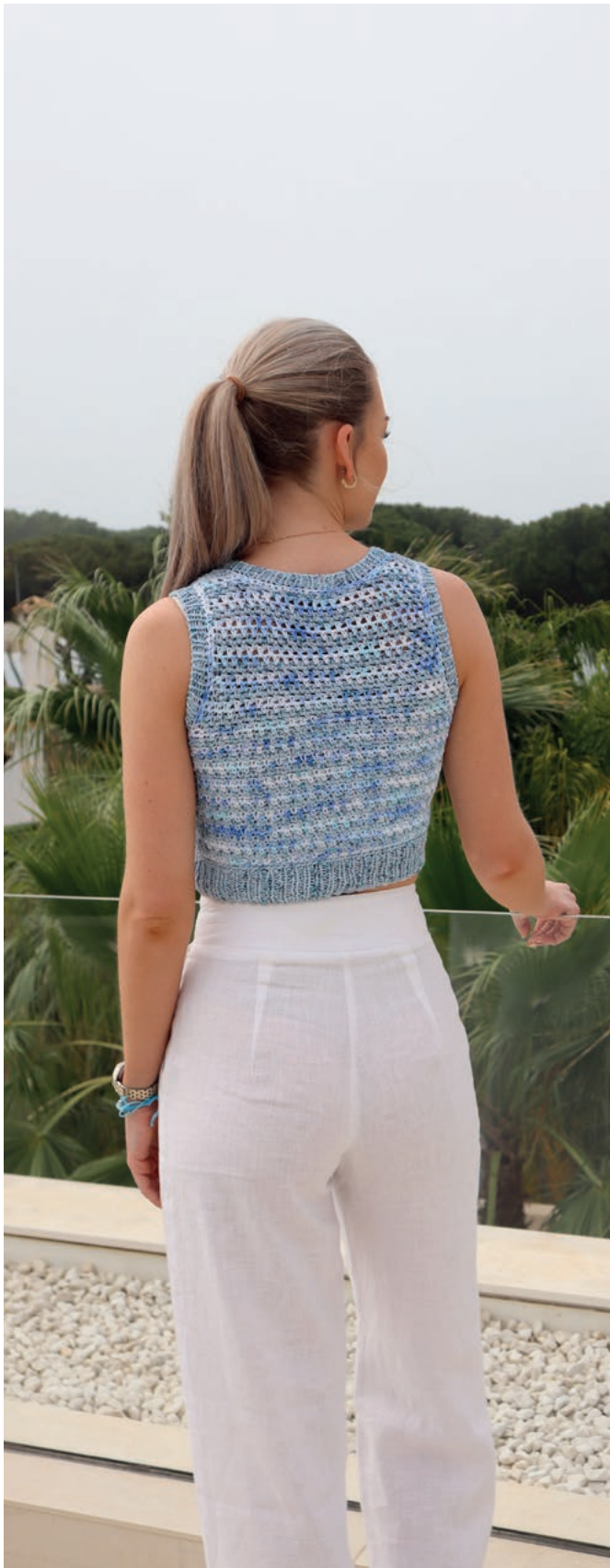
Das Model trägt Größe 2XS–XS.