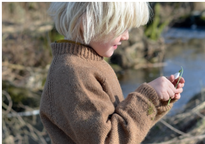
Das Patentmuster nur in den Raglanabn str.