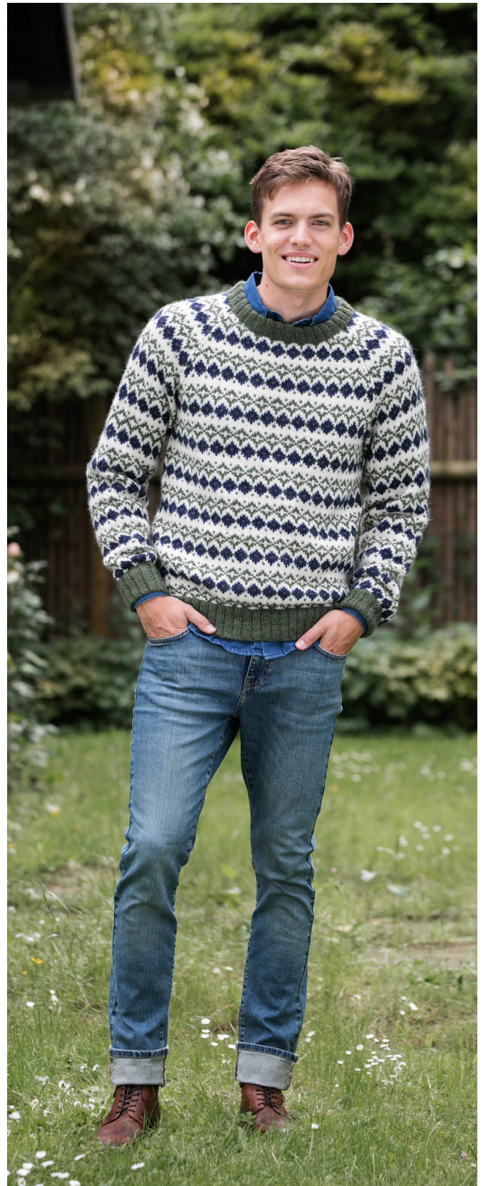
STYLIST: JAN GUNNAR SVENSON @STYLESVENSON