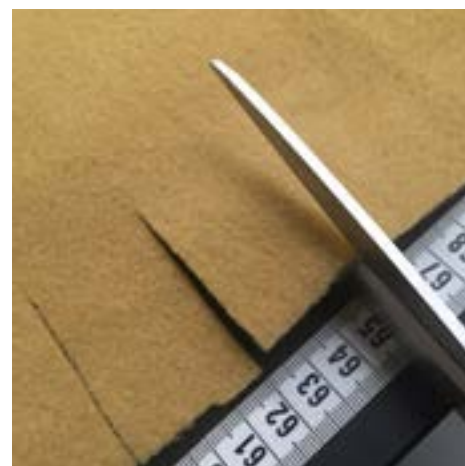
2. Klipp fransar runt hela kanten som är ca 3 cm breda och ca 4–5 cm långa.