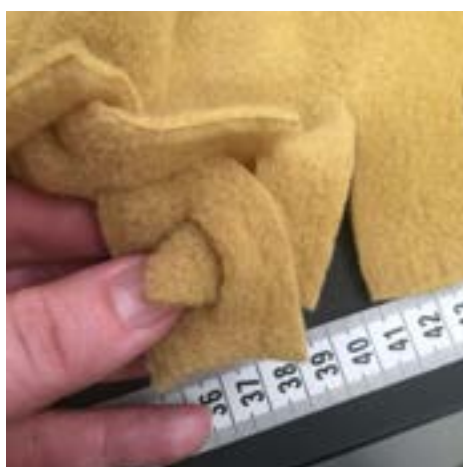
4. Ta den första fransen och dra den igenom nästa frans. Upprepa hela vägen runt så att det skapas en flätad kant.