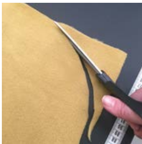
1. Klipp till rundade hörn om du vill ha fransar runt hela mattan.