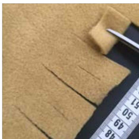
3. Klipp ett snitt i mitten av varje frans genom att vika dem dubbelt.