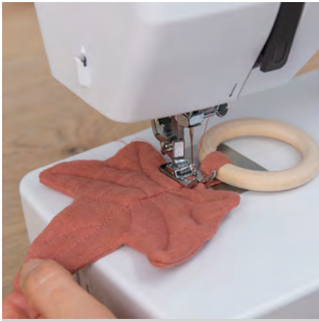
7. Den Stil an das Blatt nähen. Tipp: Um einen Beißring zu gestalten, den Stiel vor dem Festnähen um einen Holzring falten.