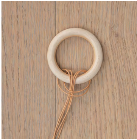
8. Mobile: 2 Lederschnüre mit einer Länge von jeweils 1,30 m so um den kleinen Holzring legen, dass sich 4 gleich lange Schnurenden ergeben.