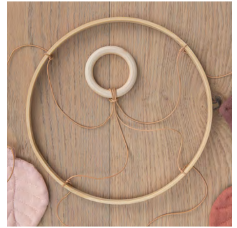
9. In einem Abstand von ca. 12 cm die Schnur an den großen Holzring binden. Jedes Blatt in einem Abstand von ca. 12 cm anbinden.