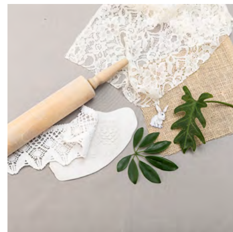
2. Du kan använda många olika material för att göra mönster i leran - släpp lös fantasin!