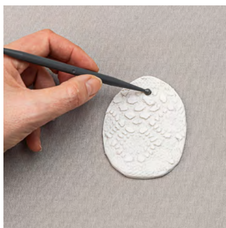
4. Gör ett hål att hänga i innan leran ska in i ugnen. Lägg de färdiga skapelserna på en plåt med bakplåtspapper. Baka på 130 grader i vanlig ugn i 20 - 30 min