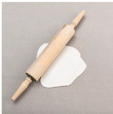
1. Kavla ut leran - inte tunnare än 2 mm.