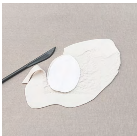
3. Lägg en mall över leran och skär ut runt mallen.