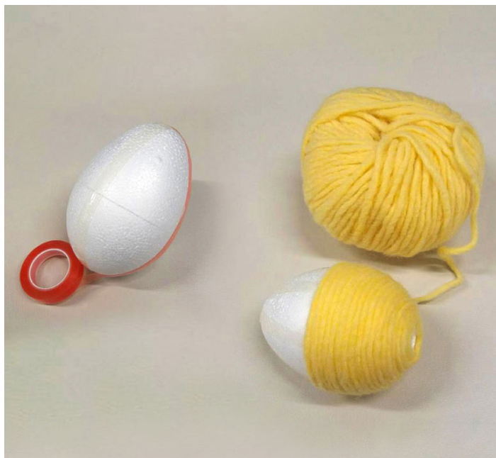
1. Surr gult garn rundt et styropor egg.