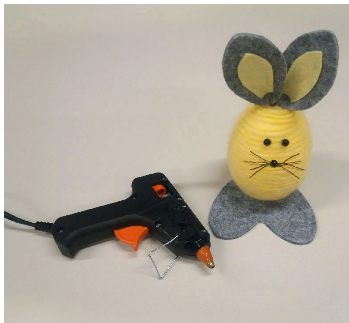
4. Klipp noen tråder eller wire til værhaar og nese, og fest dem på egget