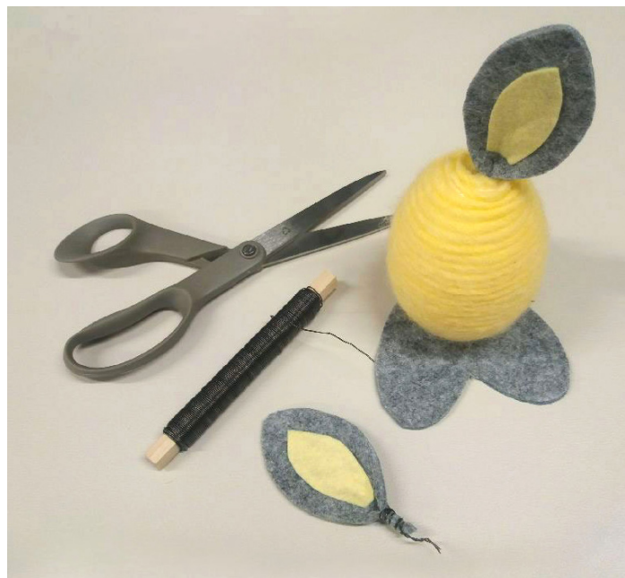
2. Klipp ut öron och fötter i kraftig filt och fäst dem på ägget.