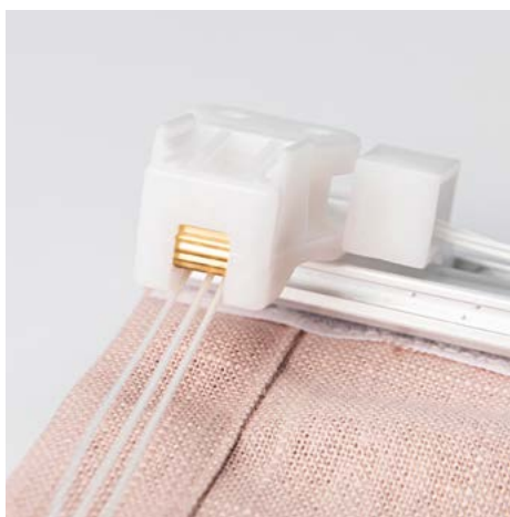
14. Alle snorer skal gjennom snorlåsen og ut under det lille stålhjulet. Samle alle snorer, klipp dem i samme lengde og monter snorlåsen.