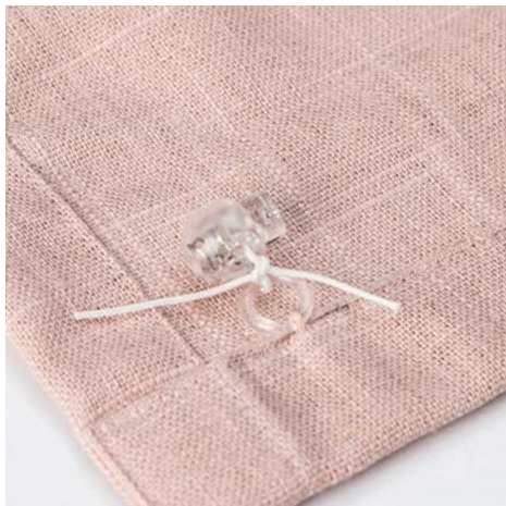
7. Knytt snorstopperne fast i ringen.