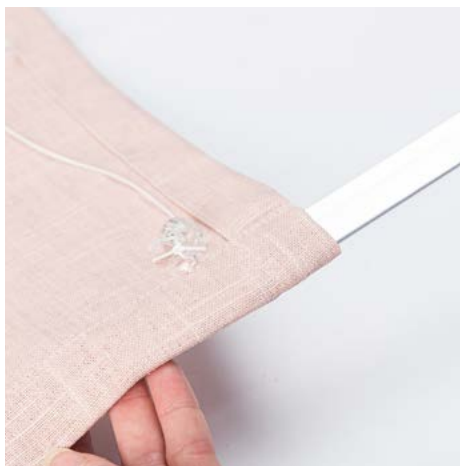
11. Legg bunnstangen i løpegangen, og sy sammen åpningene for hånd.