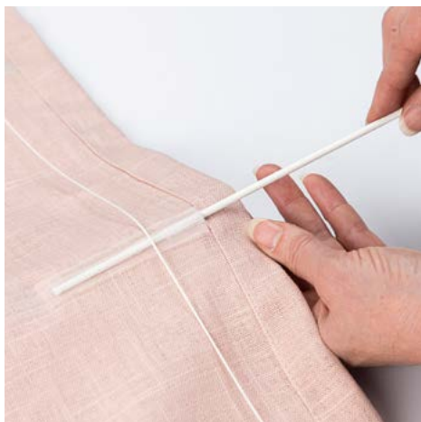
10. Skyv fiberstengene inn under liftbåndene.