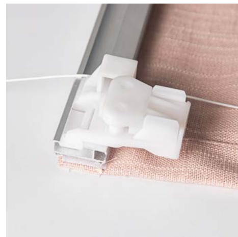
12. Sett snorlåsen på utsiden av snorøyet i den ene siden. Du bestemmer selv om det skal være venstre eller høyre avhengig av hva som passer best til vinduet.