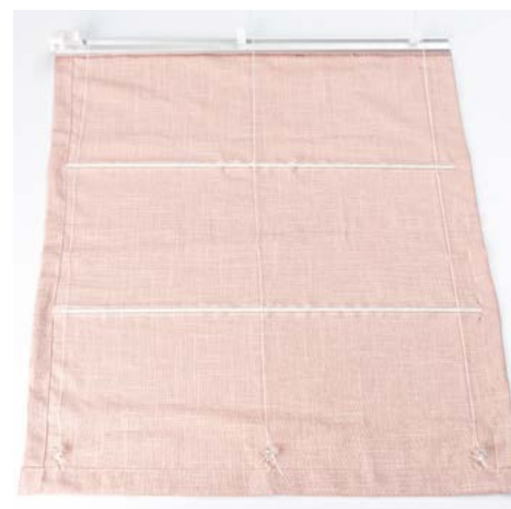
15. Fäst gardinen på stängan med hjälp av kardborrbandet.