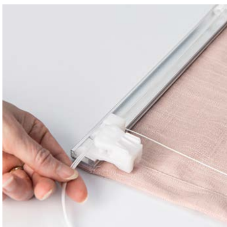
13. Därefter trär du in snöret i snörögat och ut genom snörstoppet på höger/vänster sida.