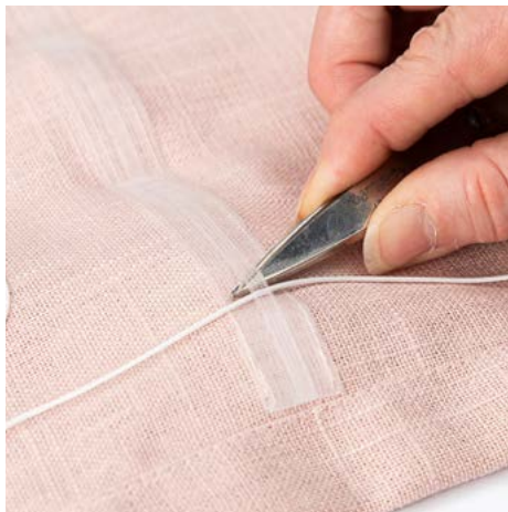
8. Klipp till lika många snören som det finns snörögon. Snörena ska vara 2 x längden + 1 x bredden. Trä snörena lodrätt genom de små öglorna på hissbandet.