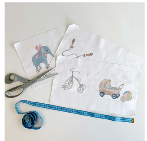
2. Teile das Musterstück in 2 Stücke von 39 cm Länge und 1 Stück von 20,5 cm, die Höhe beträgt 22 cm.