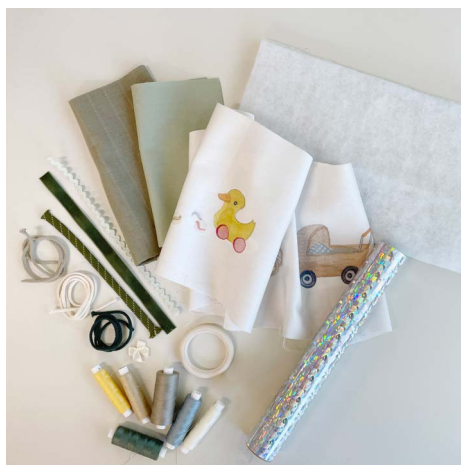
1. Das brauchst Du.

In diesem Beispiel zeigen wir sowohl die Verwendung des Musterbeispiels als auch der von Dir entworfenen individuellen Seiten.