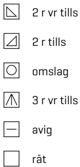
Diagram fram- och bakstycke